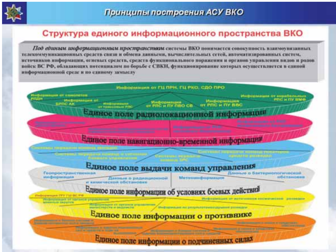
Рис. 11. 26