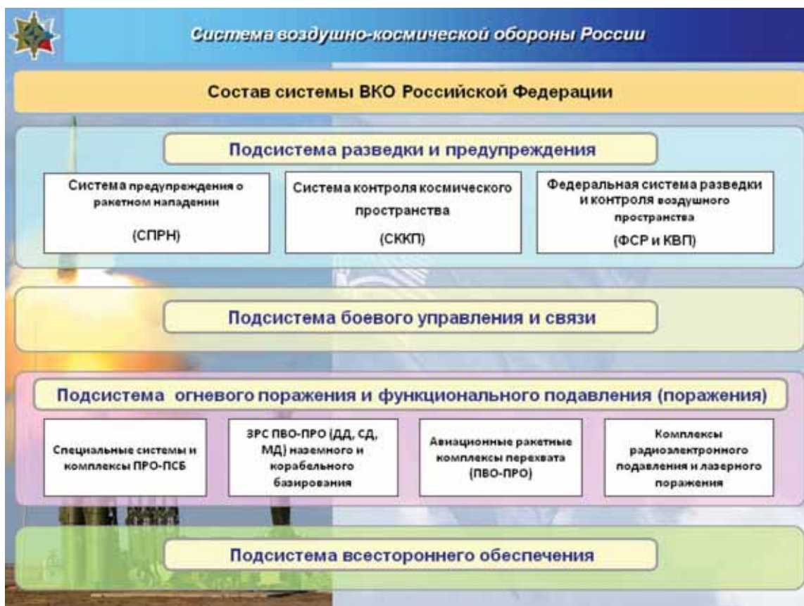
Рис. 10. 25