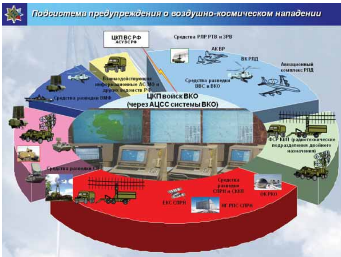
Рис. 12. 27