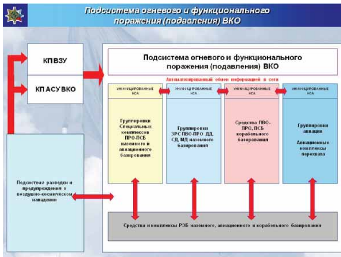
Рис. 13. 28

вредность. Понятно, что единственным реальным средством противодействия воздушно-космическому нападению становятся средства ВКО. Они же, будучи оформлены в адекватную военную доктрину, могут стать и главным инструментом военно-политической интеграции в Евразии, т. е. помочь реализовать сценарий военно-политической интеграции в Евразии. Это может быть тот редкий случай, когда внешне выглядевшие военно-технические решения становились влиятельными средствами политики. Решение этой задачи однако под силу лишь нескольким государствам, либо коалициям. Система ВКО предполагает, в частности, разработку, создание, развертывание и эксплуатацию следующих основных подсистем, которые показаны на рисунке (рис. 10).