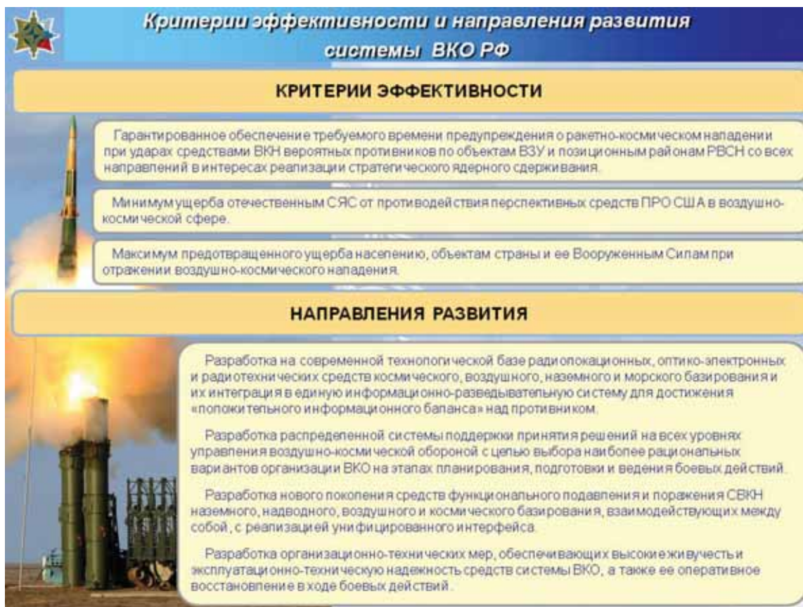
Рис. 9. 24