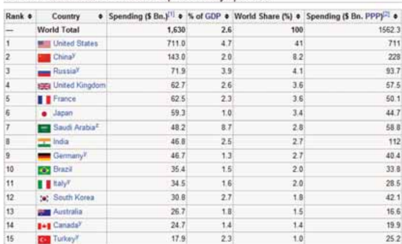
SIPRI Yearbook 2011 - World's top 15 military spenders

Безусловными мировыми лидерами по военным расходам являются США (711 млрд долл.) и Китай (143,0 млрд долл.), чьи доли в мире составляют 41% и 8,2% соответственно. Если же учесть военные расходы других союзников США — Германии, Саудовской Аравии, Италии, Южной Кореи, Канады и Турции, — то становится ясно, что военные возможности России (даже с учетом расходов КНР) никогда не будут в ближайшие годы даже сопоставимы с расходами ведущих развитых государств 1 .