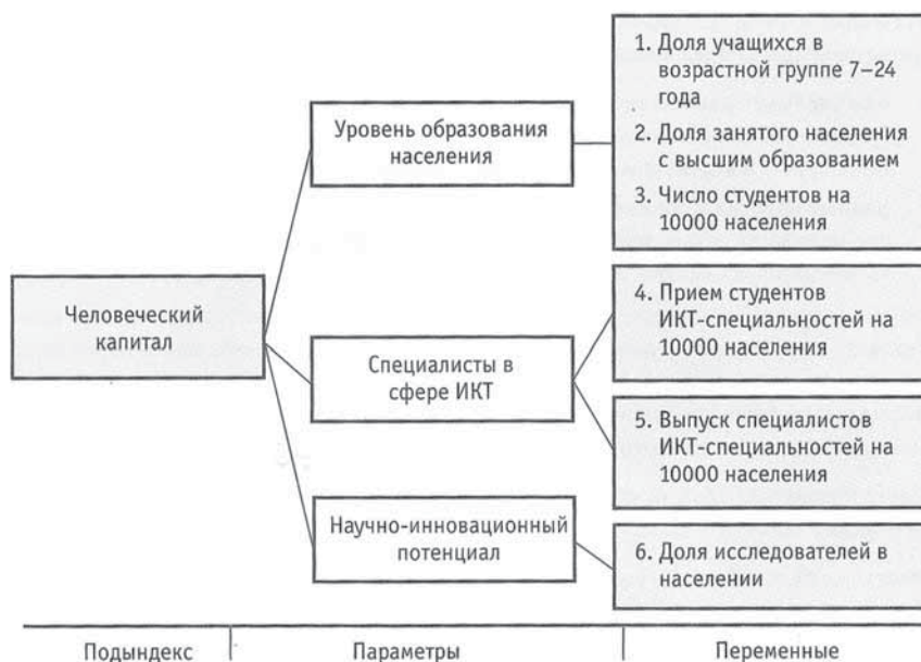
Рис. 8. Структура подындекса «человеческий капитал»

Национальный человеческий потенциал является самостоятельным и сложным интенсивным фактором развития, собственно, фундаментом роста ВВП в сочетании с инновациями и высокими технологиями в современных условиях. Важнейшими его компонентами в последнее десятилетие выступают наука, образование и информационно-коммуника-