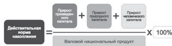
Рис. 4. Расчет действительной нормы накопления

Наблюдаемое различие в структуре богатства целиком обусловлено тем, что на одного западноевропейца в среднем приходится в 13–14 раз больше человеческого и произведенного капиталов (рис. 3).