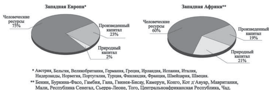
Рис. 3. Составные части национального богатства, экспертные оценки на 1994 год

Добавлю, очевидной потребностью. Потребностью, прежде всего, повышения качества госуправления . Особенно в условиях кризиса 2008–2012 годов. Что, собственно, и стало центром общественной дискуссии: реформа МВД, «мигалки» и т. д. — лишь ее отражение.